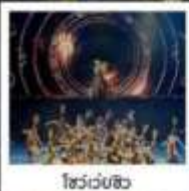
โชว์เวบซี