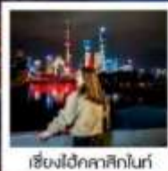
เชียงใหม่คลาสสิกไนท์