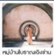
หมู่บ้านโบราณเฉิงชาน