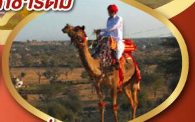
ฟรี ขี่อูฐ เมืองมันทาวา ราคาเริ่มต้น