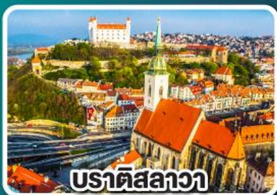
ปราตีสลาวา