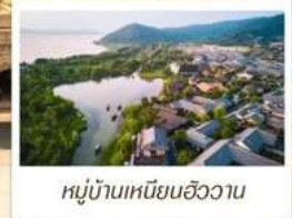
หมู่บ้านเหนียนฮิววาน

🧳 โหลด 23 KG. x1 ทั้งไป - กลับ ✓ พรีเมียมทิวส์ ✓ ไม่เข้าร้านรัฐบาล ✓ ทิวส์กรุ๊ปเล็ก ✓ รวมค่าเข้าสถานที่ตามโปรแกรม