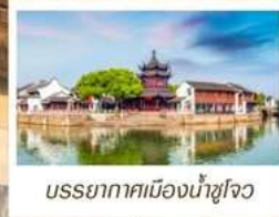
บรรยากาศเมืองน้ำซูโจว