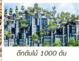
ตึกต้นไม้ 1000 ต้น