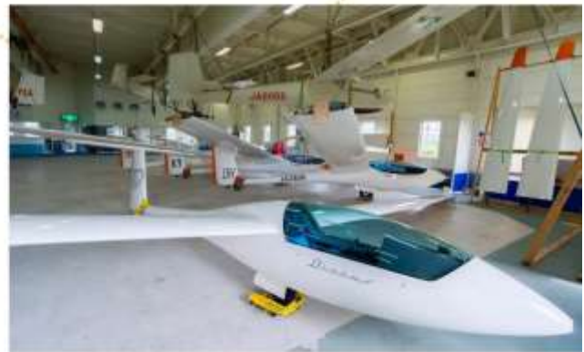
รับประทานอาหารกลางวัน ณ พิพิธภัณฑ์