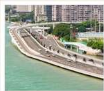
สะพานเหยียนหฺวู่เฉียว