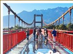
สะพานแก้วลี้เจียง