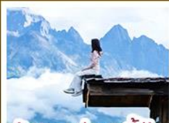
ร้านอาหารฟิชเชียนต้าอัน

ชมวิวภูเขาหิมะสวยสุดโรแมนติกกับแสงยามพลบค่ำ เที่ยวเมืองโบราณต้าหลี่ ลี้เจียง ป๋อซา แขงกรี่ล่า ชมวิถีชีวิตของชุมชนยูนนานและทิเบต พิสูจน์ความกล้าท้าเดินชมสะพานแก้วลี้เจียง • ซุปโป่งเพลินที่ถนนคนเดินหนานผิงเจียง