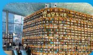
ห้องสมุดสตาร์ฟิลา