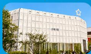
บรักคินกาตลี