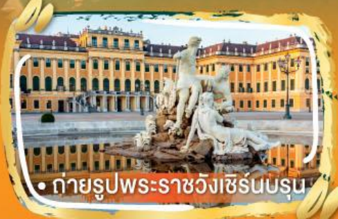
• ถ่ายรูปพระราชวังเซรินบรุน