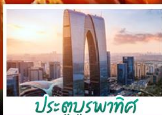
ประตูบูรพาทิศ