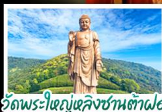
วัดพระใหญ่เฉิงชานต้าฝอ