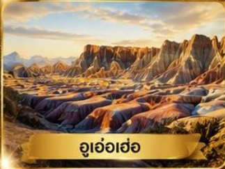
อู่อ๋อเฮ่อ