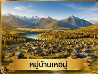
หมู่บ้านเหม่อมุ่

อูหลุมู่จี • ธารน้ำห้ำสี่ • แกรนด์แคนยอนขุยถุน • หมู่บ้านเหม่อมุ่