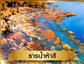
ธารน้ำห้ำสี่