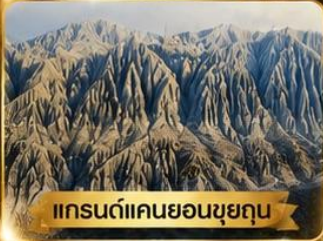
แกรนด์แคนยอนขุยถุน