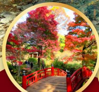
สวนดอกบ๊วยอาคาบิ