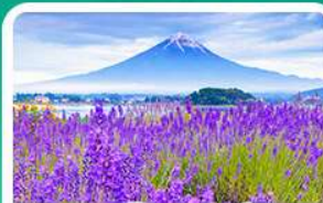
สวนโออิชิปาร์ก