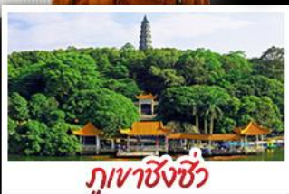
ภูเขาชิงชิว