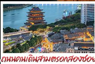
ถนนคนเดินสามตรอกสองซอย