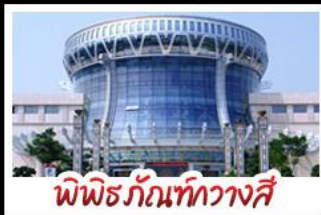
พิพิธภัณฑ์กังวานสี

สวนสนุก FANTASYLAND - หมู่บ้านสไตล์ยุโรป พิพิธภัณฑ์กังวานสี - ถนนคนเดินสามตรอกสองซอย ท่าเรือกิ่งจื่อ - ศาลเจ้าแม่กวนอิมพันกร เมนูพิเศษ อาหารกังวานตุ้ง , สุกีชาบูหม่าล่า