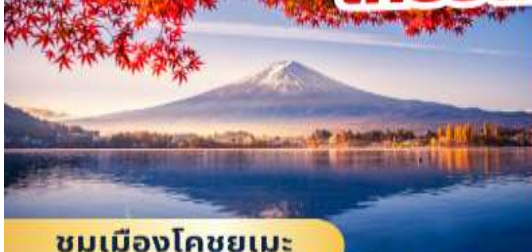
ชมเมืองโคชูยูเมะ