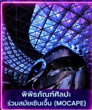
พิพิธภัณฑ์ศิลปะร่วมสมัยเซินเจิ้น (MOCAPE)