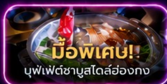
มือพิเศษ! บุฟเฟ่ต์ชาบูสุโตส์ฮ่องกง

UpperHills จุดถ่ายรูปสุดชิบของวัยรุ่นเซินเจิ้น - OCT Loft ย่าน Creative Park - OCT Harbour Happy Coast - Shenzhen Bay Culture Plaza - Cyberpunk พิพิธภัณฑ์ศิลปะร่วมสมัยเซินเจิ้น (MOCAPE) - Joy City Center (One Avenue) - Shenzhen Civic Center - shigu garden - วัดเจ้าแม่กวนอิม - วัดแชกงหมิว