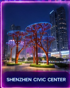
SHENZHEN CIVIC CENTER