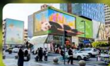
ไท่กุ่หลี่