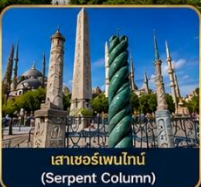
เสาฮอร์เพนไทน์ (Serpent Column)