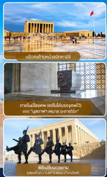
บริเวณด้านหน้าอนีกาบิร์

สถานที่สำคัญที่คนตุรกีให้ความเคารพและจดจำผู้นำผู้ยิ่งใหญ่ ที่อุทิศทั้งชีวิตเพื่อชาติ ศาสนา และประชาชน