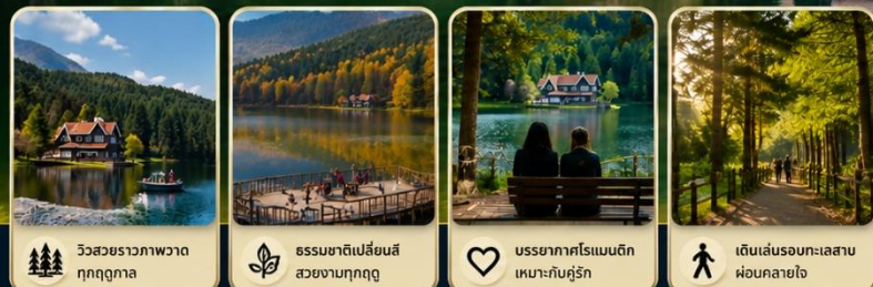
วิวสวยราวภาพวาด ทุกฤดูกาล | ธรรมชาติอันสวยงาม สดชื่นทุกฤดู | บรรยากาศโรแมนติก เหมาะกับคู่รัก | เดินเล่นรอบทะเลสาบ ผ่อนคลายใจ

จุดหมายยอดนิยมของนักท่องเที่ยว สำหรับการพักผ่อนและใกล้ชิดธรรมชาติ