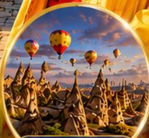
เมืองคัปปาโดเกีย Cappadocia