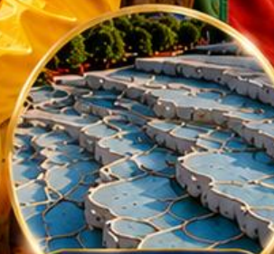
ปามุกคาล่า Pamukkale