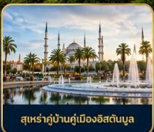
สุเหร่าบ้านคูเมืองอิสตันบูล