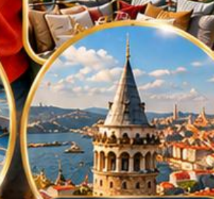
หอคอยกาลาตา Galata Tower