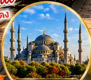
สุเหร่าสีน้ำเงิน Blue Mosque