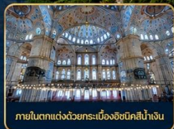
ภายในตกแต่งด้วยกระเบื้องอิสตันบูลสีน้ำเงิน