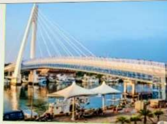
สะพานคู่รักต๋นส่วย