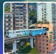
รถไฟฟ้าชุดัก