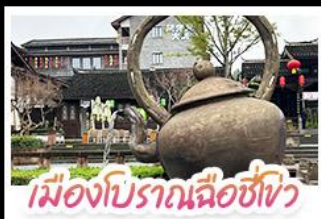
เมืองโบราณฉือซีเซว