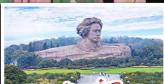
เกาะส้มจวีจี้โจว