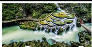
แกรนด์แคนยอนหลงเหอริ่น

เขาฟ่านจิ้ง - เมืองโบราณฝูหลงเจิน เมืองโบราณเฟิงหวาง - เกาะส้มจวีจี้โจว แกรนด์แคนยอนหลงเหอริ่น - ไม่เข้าร้านช้อปปิ้ง พักโรงแรม 5 ดาว - รถไฟความเร็วสูง