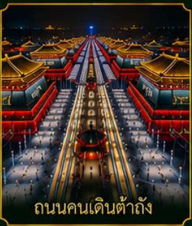
ถนนคนเดินต้าถัง