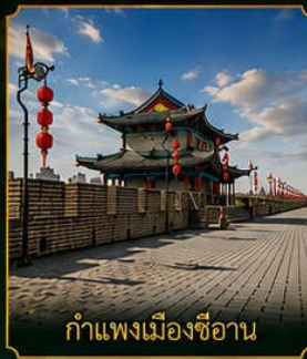
กำแพงเมืองซีอาน