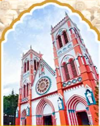
ปอนตีเชอร์