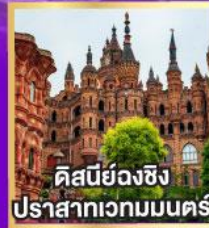
คิสบีย่งฉิ่ง ปราสาทเวทมนตร์