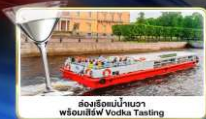
ล่องเรือแม่น้ำมววา พร้อมเสิร์ฟ Vodka Tasting

📅 เดินทาง : 14-21 มิ.ย.69 / 28 มิ.ย.-05 ก.ค.69 / 24-31 ก.ค.69