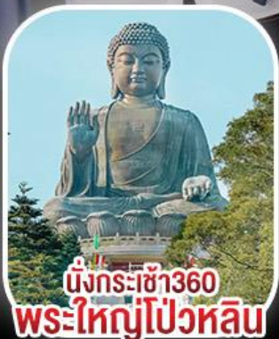
นั่งกระเช้า360 พระใหญ่โป้วหลิน