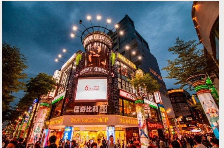
ตลาดกลางคืนซีเหมินติง (Ximending Night Market)

เย็น อิสระอาหารเย็นตามอัธยาศัย ณ ตลาดกลางคืนซีเหมินติง