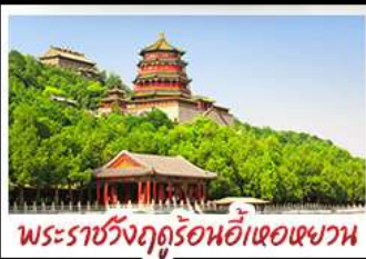
พระราชวังฤดูร้อนอ้าหอยหวง

ท่าแพงเมืองจินด่านจวียงกวน - พระราชวังฤดูร้อนอ้าหอยหวง สวนจิ้งอัน - วัดลามะ - โมเดลร้านช้อปปิ้ง - โรงแรม 4 ดาว มือพิเศษ เปิดปีกกึ่ง สุกีมองโกล MICHELIN GUIDE ร้าน TAO TAO JU