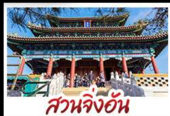
สวนจิ้งอัน