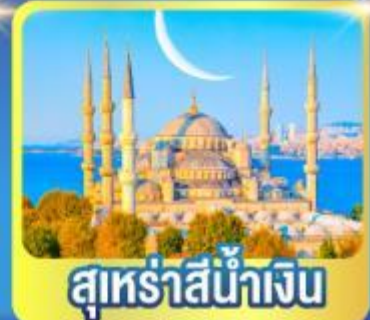
สุหรัสน้ำเงิน