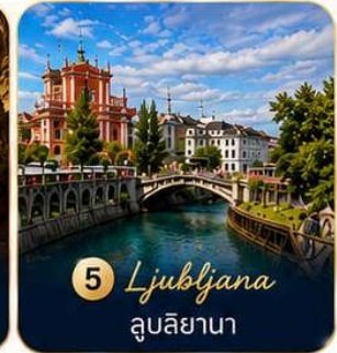
5 Ljubljana ลูบลิยานา