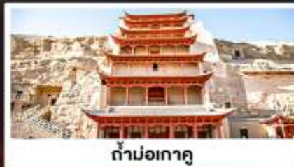
ถ้ำม่อเกาตุ