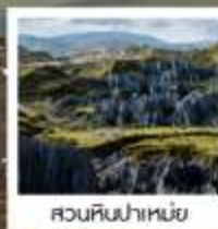
สวนหินป่าเหมย