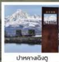
ป่ากลางเซิงตุ