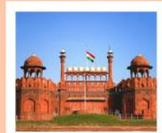
♥♥ Agra Fort