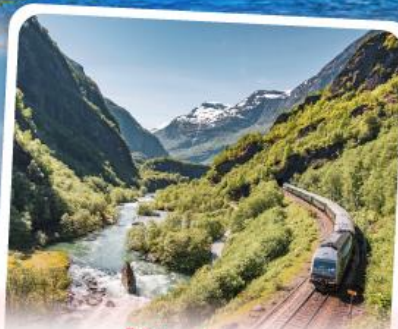
พหลิมส์บานา รถไฟเส้นทางสายโรแมนติก