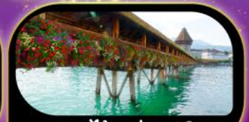
สะพานไม้ชาเปล คูซีน