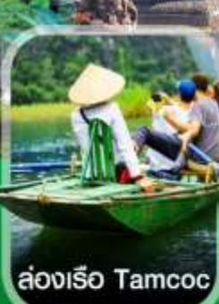
ล่องเรือ Tamcoc

✈️ คอนเฟิร์มออกเดินทาง ✈️ ทุกพีเรียด 2 ท่านขึ้นไป