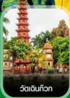
วัดเงินทิว