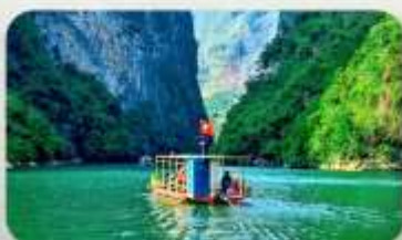
ล่องเรือ Ma Pi Leng Pass

YEN BIEN LUXURY 4* หรือเทียบเท่ามาตรฐานเวียดนาม