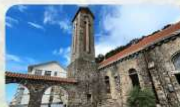
Tam Dao Stone Church