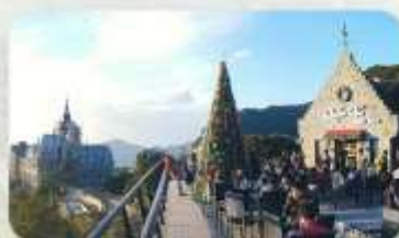
Gio Cafe Tam Dao