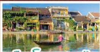
เมืองโบราณเฮงฮัน

! พักบานาฮิลล์ 1 คืน ! สัมผัสอากาศเย็นตลอดปี สโตร์ฝรั่งเศสสุดคลาสสิก - นั่งกระเช้ายาวที่สุด สู่มานาฮิลล์ สุกสุดมันส์ไปกับสวนสนุก The Fantasy Park นมัสการเจ้าแม่กวนอิมองค์ใหญ่ที่สุดของเมืองดานัง - เช็กอินเมืองมรดกโลกฮอยอัน - สนุกสนานไปกับกิจกรรม!!นั่งเรือกระดิง หมู่บ้านกัมทาน เช็กอินร้านกาแฟ SON TRA MARINA CAFE - ไม่หลงร้านช้อปปิ้ง - อิ่มอร่อยกับบุฟเฟ่ต์นานาชาติ , หม้อไฟซีฟู้ด