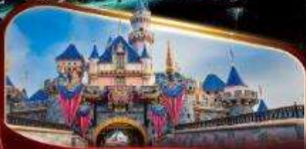
ดิสนีย์แลนด์พาร์ค