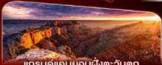
แกรนด์แคนยอนฝั่งตะวันตก

พักลาสเวกัส 2 คืน เต็มอิ่มกับแสงสีแห่งอเมริกา