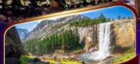
อุทยานแห่งชาติโยเซมิตี