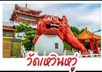
วัดเขวินเซวู

อวลีซาม - ทะเลสาบสุริยอินจันตรา - ไทเป101 วัดหวินหู้ - อนุสรณ์สถานเจียง ไคเชก วัดหลงชาน - ตลาดกลางคืนซีเหมินติง เมนู หม้อหนึ่งจักรพรรดิ - เซี่ยวหลงเปา - ชาบูไต้หวัน