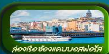
คลองเรือ ช่องแคบบอสฟอรัส