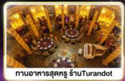
ทานอาหารสุดหรู ร้านTurandot