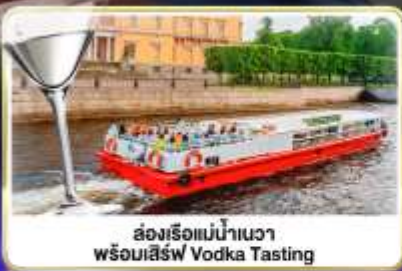
ล่องเรือแม่น้ำวอวา พร้อมเสิร์ฟ Vodka Tasting