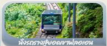
นั่งรถรางสวยอดเขาฟลอรอน