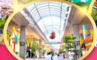
ช้อปปิ้ง ถนนอิชิบังโจ