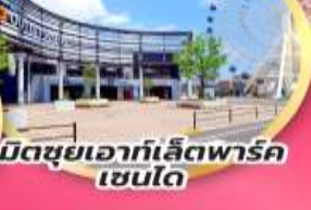
มิตซูเอากะเลียตพาร์ค เซนได

หมู่บ้านชาบูโร คาคุโนะ ดาเตะ พักออนเซ็น 1 คืน | พักเซนได 2 คืน