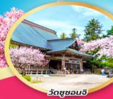
วัดชูซอนจิ