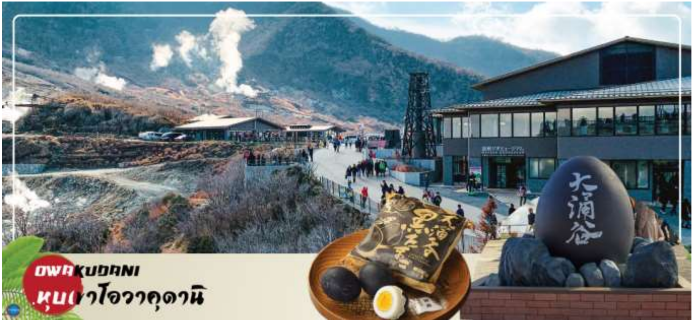
HAKONE DANI หุบเขาโอวาคุดานิ

จากนั้นนำท่าน ชมวิวทะเลสาบ 5 ศาลเจ้าฮาโกเนะ (Hakone Shrines) (ใช้เวลาเดินทางประมาณ 30 นาที) ศาลเจ้าเก่าแก่ในศาสนาชินโต ตั้งอยู่บริเวณตีนเขาฮาโกเนะ และอยู่ริมทะเลสาบอะชิ จังหวัดคานากาวา ประเทศญี่ปุ่น ไฮไลท์!!! เสาวโทธิสีแดง ริมทะเลสาบที่เป็นจุดถ่ายรูปยอดนิยม อีสระให้ท่านขอพรและถ่ายรูปตามอัธยาศัย