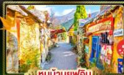
🏠 หมู่บ้านยุฟุอิน