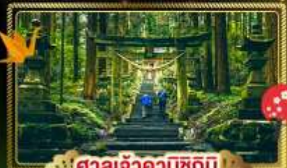
🏯 ศาลเจ้าคามิซึกิมิ