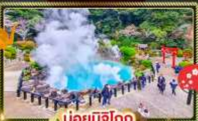
♨️ บ่อยุมิจิโกกุ