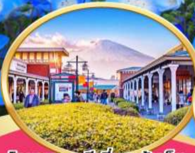
โทเทมบะพรีเมียมเอ้าเล็ท