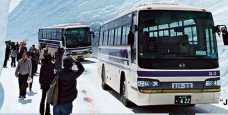
“JAPAN ALPINE ROUTE”