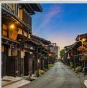
“TAKAYAMA OLD TOWN”