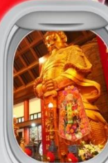
วัดฯชางหมิว